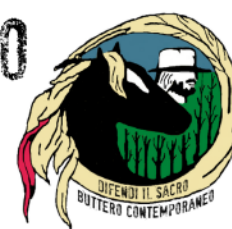
TAVOLA ROTONDA PARTECIPATA:

L'esotico di prossimità: quando il vicino diventa meraviglia